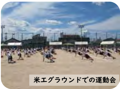
米エグラウンドでの運動会