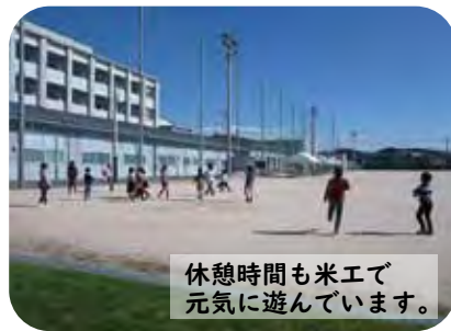
休憩時間も米工で元気に遊んでいます。