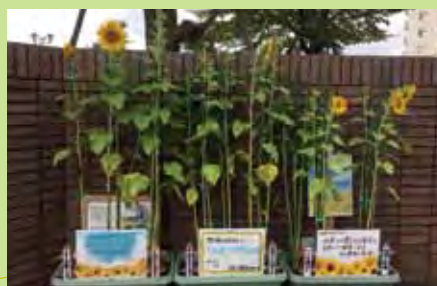
お世話になって 地域の皆様へ